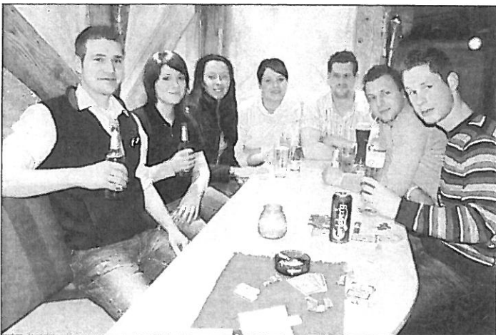
Die Edeka-Leute lassen den Abend in der Bar ausklingen