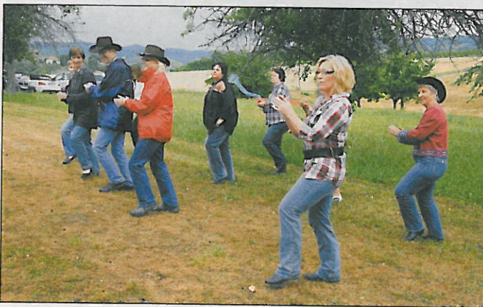
Die Musik steckt an - Die Rednecks in Aktion